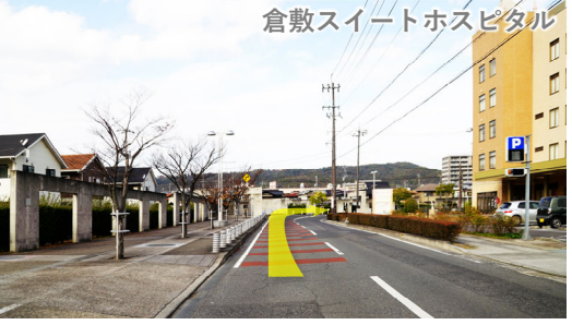
⑭ 線路手前で右にカーブ