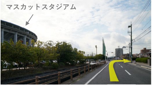
⑫ マスカットスタジアム正面玄関前の交差点を右折 (マスカット通り・中庄駅方面へ)