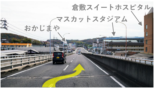
⑨ 跨線橋を下り右車線へ