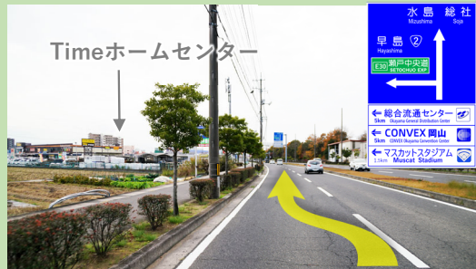
② 富本町三田線を倉敷市街方面へ左斜線を直進