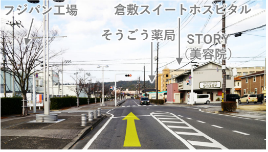
⑬ マスカット通りを北へ直進