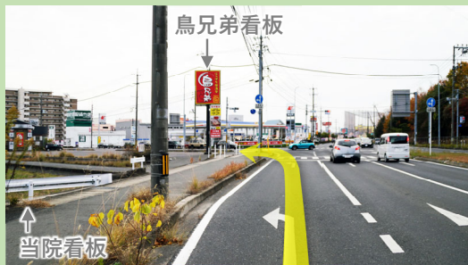
③ 二子西交差点を早島方面へ左折