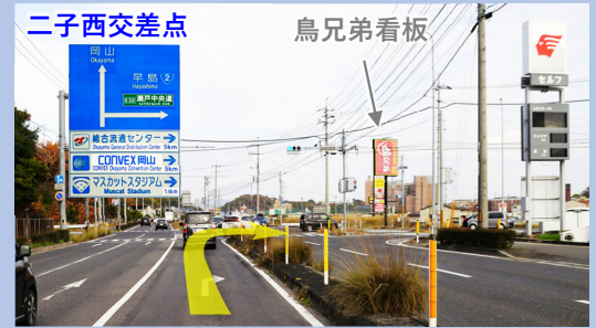
⑥ 二子西交差点を早島方面へ右折