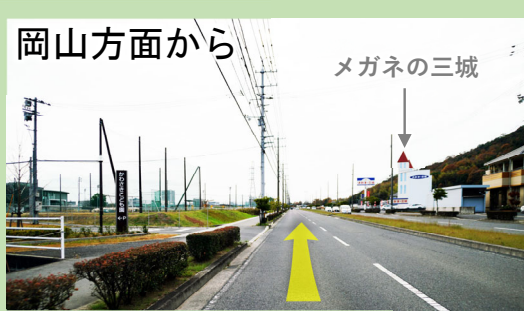
① 県道389号線から富本町三田線へ