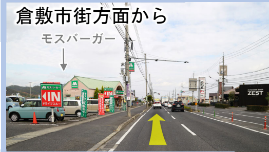
④ 三田五軒屋海岸通線を岡山方面へ直進