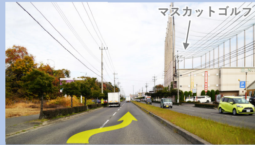
⑤ 三田五軒屋海岸通線を岡山方面へ右車線を直進