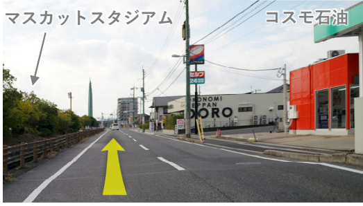
⑪ マスカットスタジアム北を西方向へ100m直進