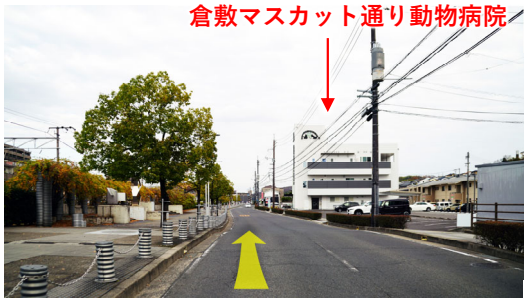
⑯ 跨線橋の下を過ぎると右手に当院