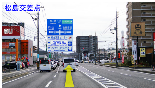
⑧ 松島交差点を直進し、跨線橋へ