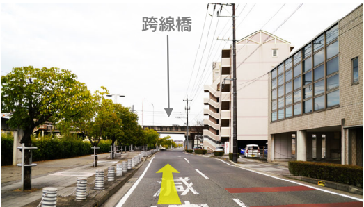
⑮ マスカット通りを線路に沿って中庄駅南口方面へ