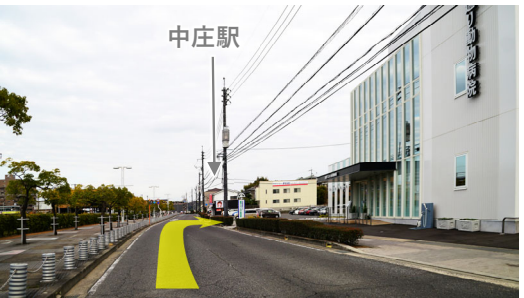
⑰ 外来用駐車場は正面と東側(中庄駅側)