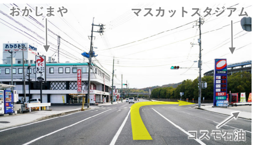
⑩ マスカットスタジアム手前の信号を右折