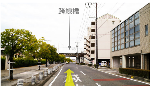
⑮ マスカット通りを線路に沿って中庄駅南口方面へ