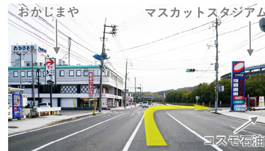
⑩ マスカットスタジアム手前の信号を右折