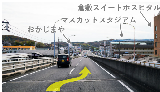
⑨ 跨線橋を下り右車線へ