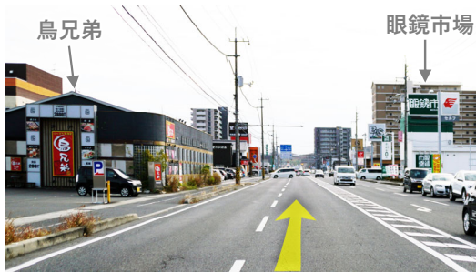
⑦ 県道187号線・右車線を早島方面へ直進