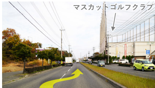
⑤三田五軒屋海岸通線をさらに直進し、右車線へ