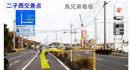
⑥二子西交差点を早島方面へ右折