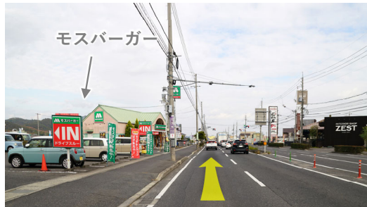
④三田五軒屋海岸通線を岡山方面へ直進