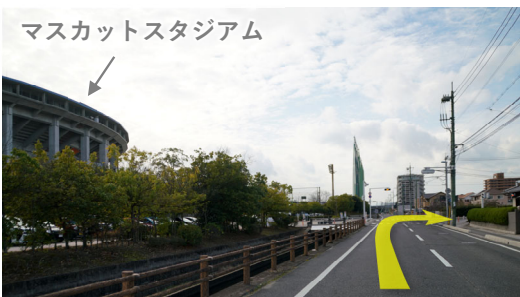
⑫ マスカットスタジアム正面玄関前の交差点を右折 (マスカット通り・中庄駅方面へ)