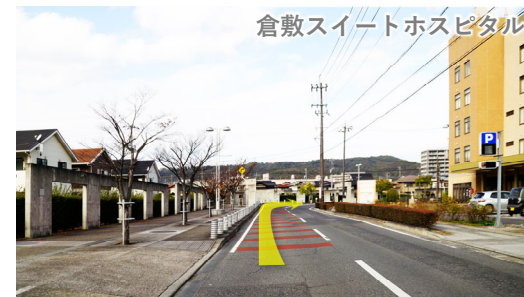
⑭ 線路手前で右にカーブ