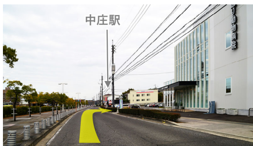
⑰ 外来用駐車場は正面と東側(中庄駅側)