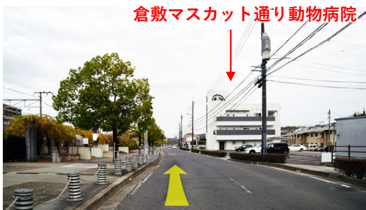
⑯ 跨線橋の下を過ぎると右手に当院