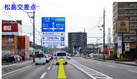
⑧ 松島交差点を直進し、跨線橋へ