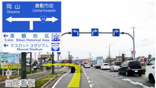
③平田交差点を岡山方面へ左折