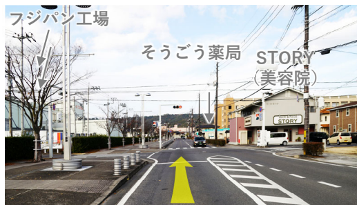
⑬ マスカット通りを北へ直進