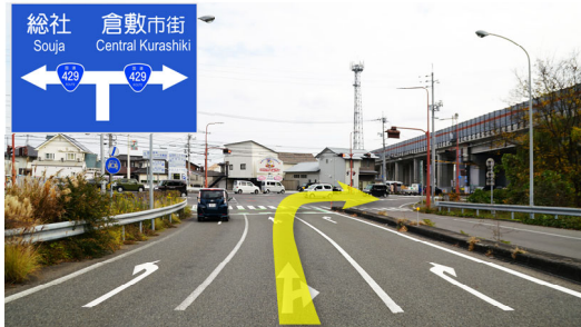
②山陽道倉敷IC出口から倉敷市街方面へ右折