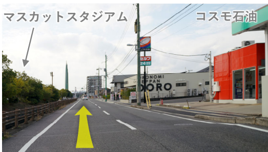
⑪ マスカットスタジアム北を西方向へ100m直進